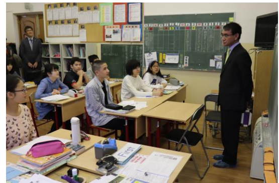
授業参観。中学部2年生の教室では、生徒の質問に英語で答えてくださいました。