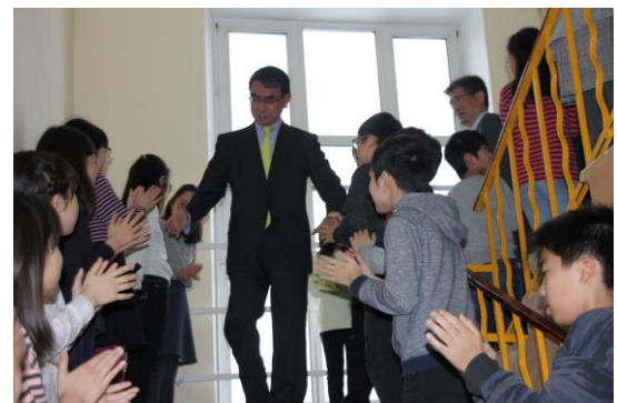
お見送り。子どもたち一人一人と握手を交わし、モス日を後にされました。

大臣ご自身の体験も交えながら、優しく語りかけてくださいました。また、図鑑一式をご寄贈いただきました。交流会の前に行われた懇談では、突然のお願いにもかかわらず、快く応じていただき、色紙に「夢」と認めてくださいました。モス日の宝物がまた一つ増えました。