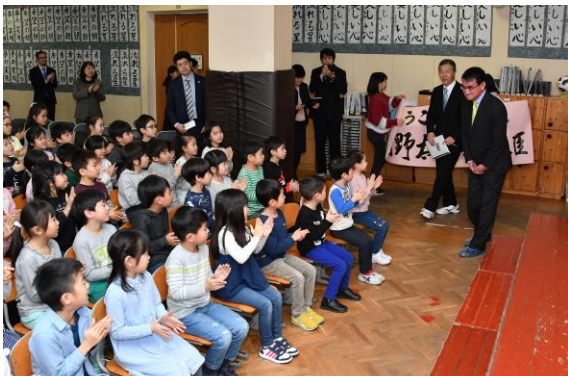
交流会。元気いっぱい、そして心を込めて「歓迎の歌」と「校歌」を披露しました。