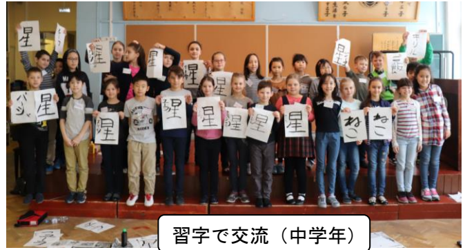
習字で交流(中学年)