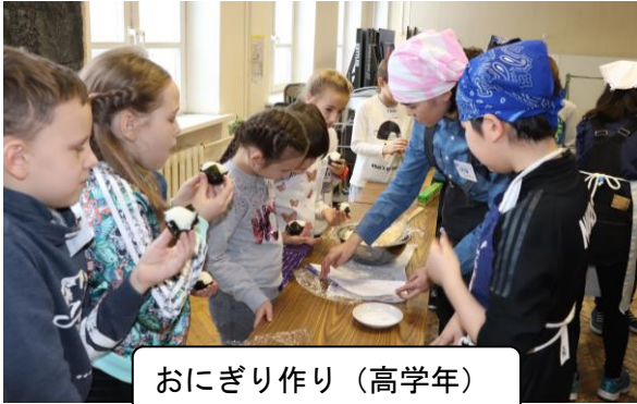
おにぎり作り(高学年)