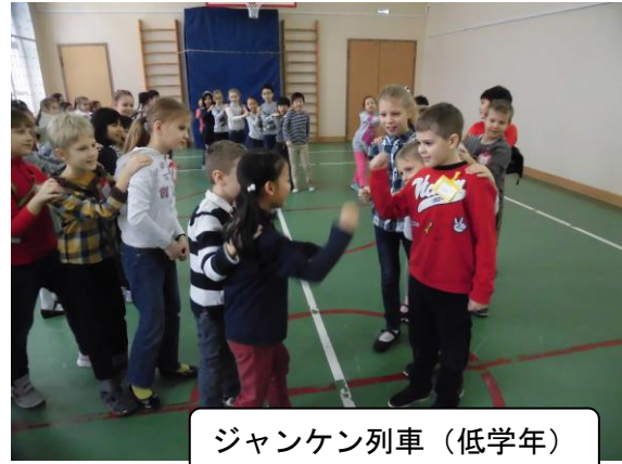
ジャンケン列車(低学年)