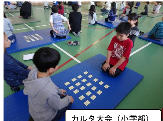
カルタ大会(小学部)