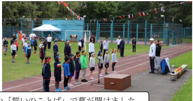
力強い選手宣誓と1年生のかわいい「誓いのことば」で幕が開けました。