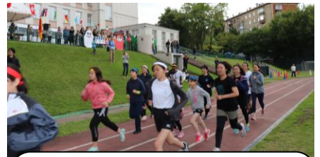
持久走 一般参加の方々も、子どもたちに交じって健脚を競い合いました。