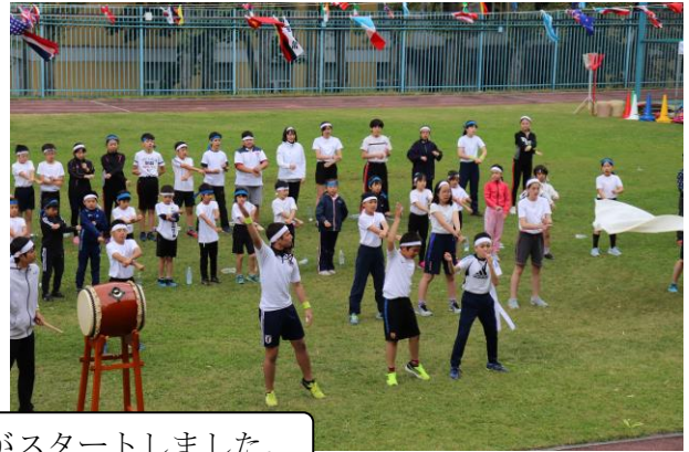
気合の入った応援合戦で午後の部がスタートしました。