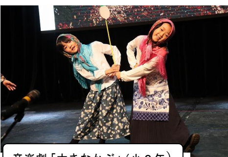
音楽劇「大きなかぶ」（小2年）