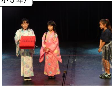
四年のワイドショー（小4年）