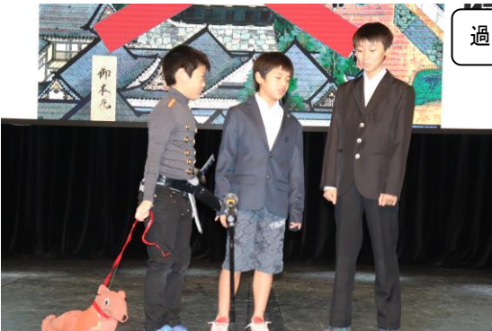
過去から未来へ～私がつなぐ～ (小6年)