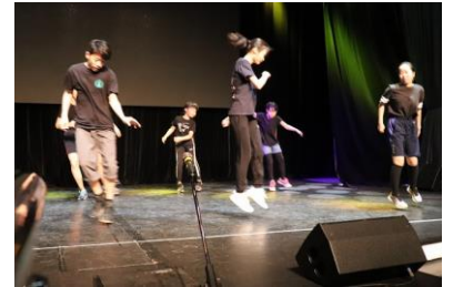
ダンス ワールドツアー in Moscow