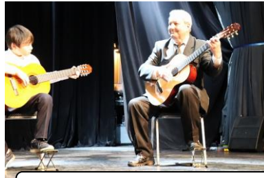
音楽「ギターアンサンブル」