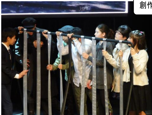
創作劇「時のカタチ」(中学部)