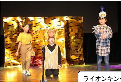
ライオンキング (小5年)