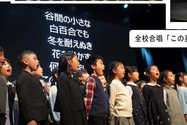
全校合唱「この星に生まれて」