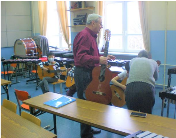
（ギターのミーシャ先生に教えていただきます）

モス日タイムが始まりました。学校のクラブ活動です。自分で選んで（クラブに限りがあるので第2希望になることもあります）活動する貴重な時間です。更に、小学部、中学部、7学年での異学年齢集団での活動は、国内ではなかなかできない貴重な体験です。中学部の生徒と4年年生が卓球で試合をしたり、中学部の生徒が司会で活動内容を決めたり、試合をするサッカーのチームと一緒に決めたりしていました。