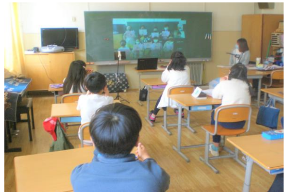
（オンラインで1年生を応援）