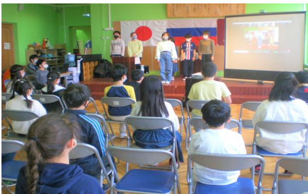
（児童総会、会長、副会長、各委員長挨拶）

学校は集団で生活する場です。本校は国内に比べて集団が小さいですが、それだけ関わりの密度は高くなります。例えばいろいろな役に挑戦できたり、役割を多く請け負ったりすることは小集団だからできる活動の特徴です。役割を果たすとみんなに褒めてもらえることも自分の自信になり、また次も頑張ろうという意欲につなげていけます。本校の特色の一つとなっています。